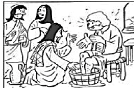
JUEVES SANTO: EL LAVADO DE LOS PIES