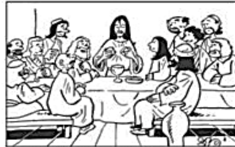
JUEVES SANTO: LA ULTIMA CENA