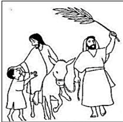
DOMINGO DE RAMOS