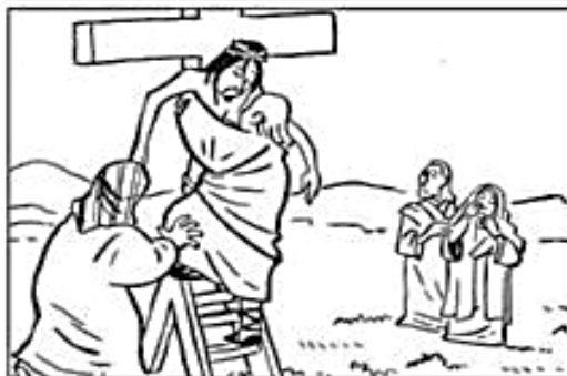
VIERNES SANTO: MUERTE DE JESUS