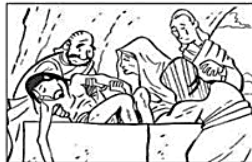
ENTIERRO DE JESUS