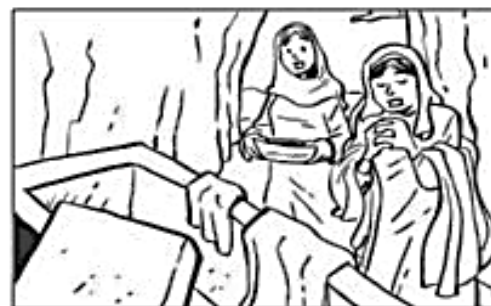
DOMINGO DE RESURRECCION