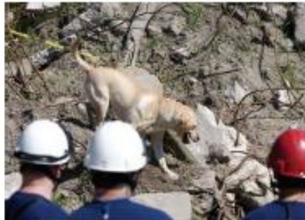
En la vida cotidiana encontramos grupos o asociaciones de individuos organizados en torno a un fin específico.

En conclusión, los seres humanos nacemos desprotegidos y necesitamos la convivencia para nuestro desarrollo .