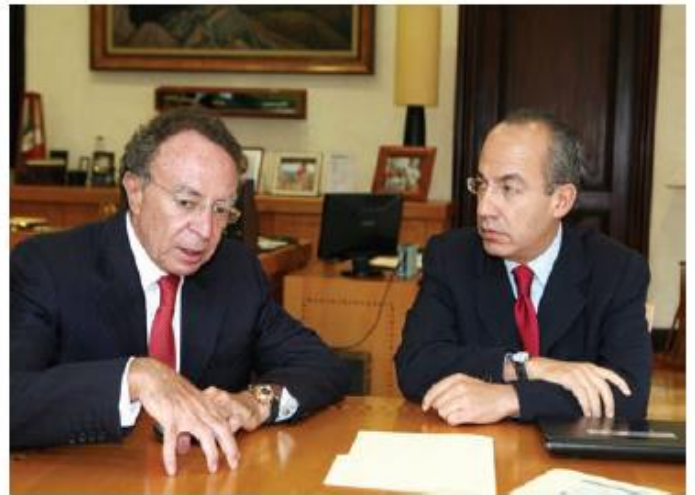
Originalmente, el Estado aparece como medio para salvaguardar la vida de una sociedad.

En cuanto al origen del Estado, Aristóteles lo estudia desde dos perspectivas que son: la genética , es decir, mirando a su origen en el tiempo y la metafísica o sus bases en orden lógico ideal.