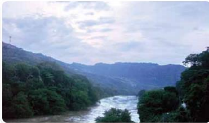
Entre las cordilleras de la región andina se ubican los valles interandinos del Magdalena y el Cauca

Resolución de Reconocimiento No 00002530 del 26 de Octubre de 2016 de la Secretaría de Educación Municipal NIT. No. 809011406 – 9 DANE 273001004073