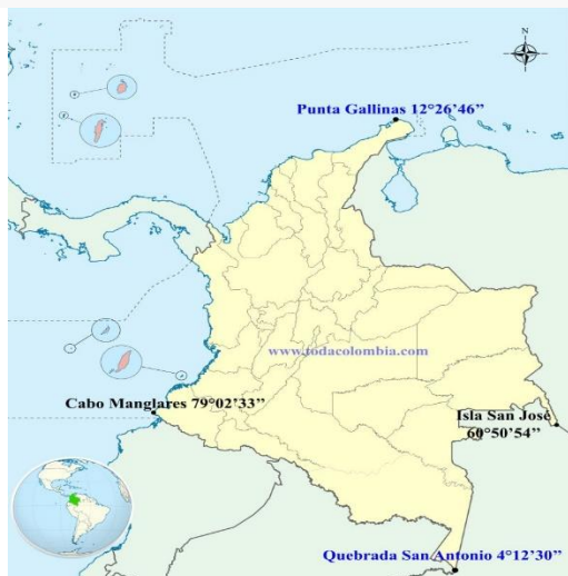
Mapa Límites de Colombia - Puntos

Por el Occidente llega hasta los 79°02'33" de longitud oeste de Greenwich, que corresponden al Cabo Manglares en la desembocadura del río Mira en el Océano Pacífico.